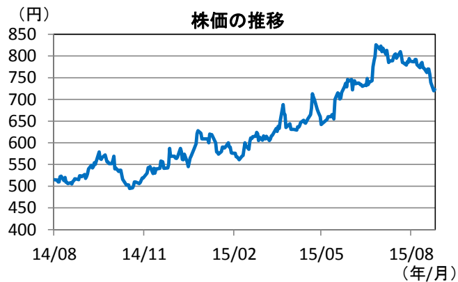
(期間) 2014年8月1日～2015年8月25日 (出所) QUICKのデータをもとに岡三アセットマネジメント作成